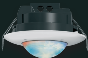
PD2N-KNXs-OCCULOG-DX 93530 / 93531