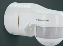
RC-plus next N 230-KNXs